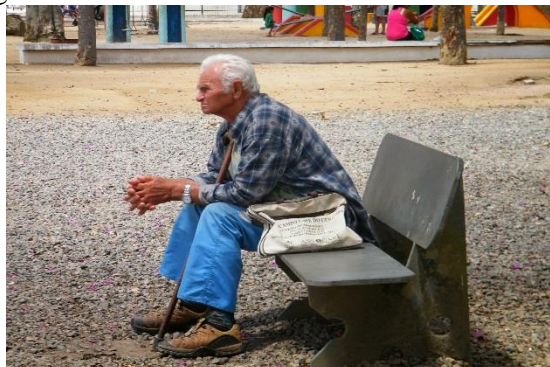
Figura 2 – Isolamento do envelhecido na sociedade atual.

Fonte: https://3.bp.blogspot.com/-OOA-bAkc6kQ/UyOp82g71_I/AAAAAAAAAFXk/yqeqlzKpZ9w0RBCDUxX-bFJphaj0vMQlwCPcBGAYYCw/s1600/DSCF4429.JPG (20 set. 2018)