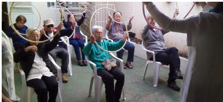
Figura 1 – Atividades com envelhecidos.