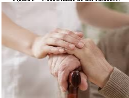
Figura 3 – Necessidade de um cuidador.

Observando-se a figura 3, pode-se dizer: